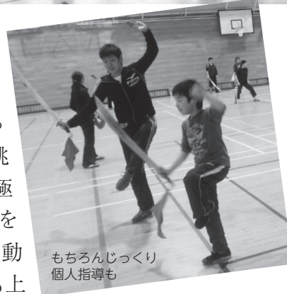
もちろんじっくり個人指導も