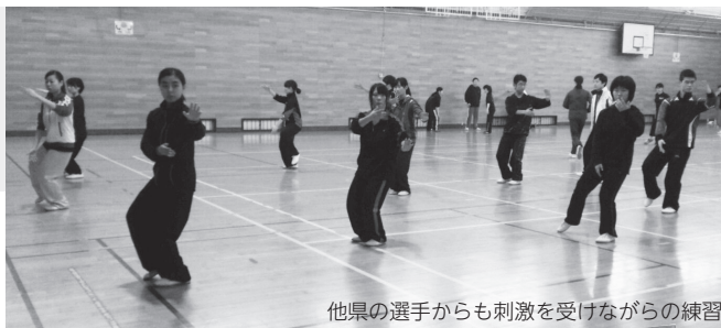
他県の選手からも刺激を受けながらの練習

合宿では長時間密度濃く動くため、柔軟・準備運動をしっかり行うところから始まります。続けて圧腿・《ティー》腿・跳躍動作などをやり、その後太極拳と長拳に分かれます。太極拳は主に歩法や難度動作、大会套路を練習、長拳は套路練習の後に基本動作の繰返し練習などで基礎体力も上げていきます。岩手にはまだ合宿に参加していないジュニアがたくさんいるので、ぜひ今後参加できるよう頑張ってもらいたいです。