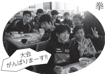
大会がんばりませー!!