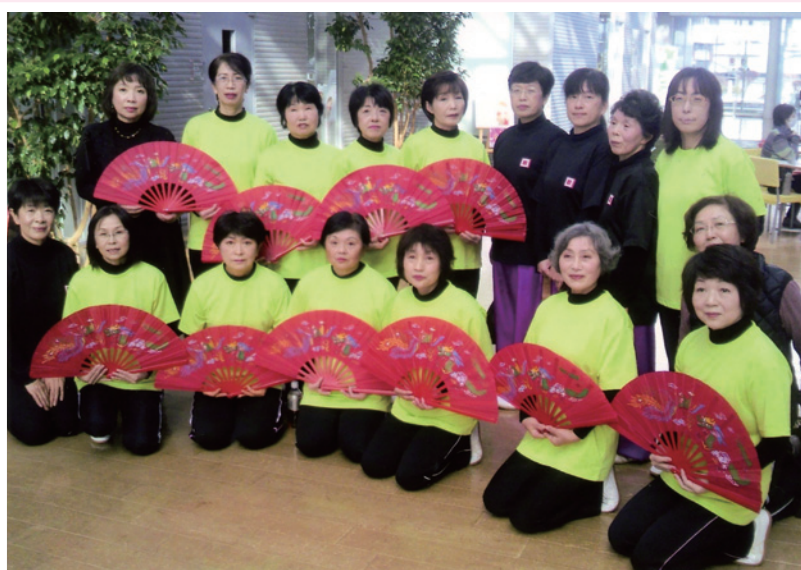
▶ 歳末チャリティー芸能大会 (2016年12月6日 北上市さくらホールにて)

今は横断幕の図柄を皆で検討を重ねています。全員で交流会に参加して横断幕を掲げる日がくることを心待な練習の日々であります。