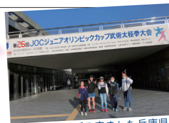
はるばる来ました兵庫県！