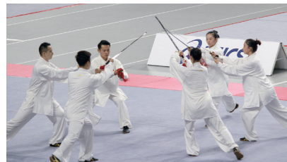
▲中国武術代表団の特別演武

最終日、日中平和友好条約締結40周年を記念して招かれた中国武術代表団の「特別演武」が、会場の武蔵野の森総合スポーツプラザで練り広げられました。オリンピックの影響で今年はここで、来年は岡山でと会場が変則的ではありますが、気持ちも新たにまたチャレンジの1年の始まりです。